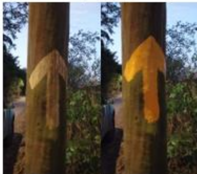
REFORÇO NA SINALIZAÇÃO