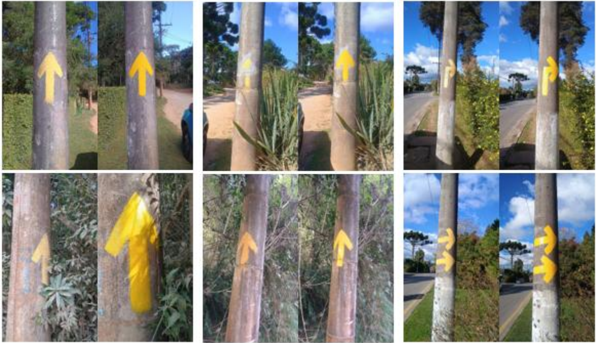
INSTALAÇÃO DE NOVA SINALIZAÇÃO