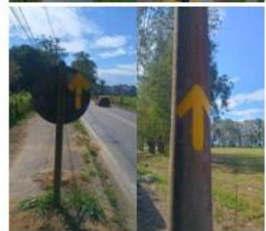
MANEJO DE PLACAS E POSTES