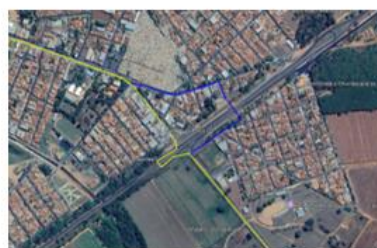
ALTERNATIVA EM AZUL, PASSANDO PELA FAIXA DE PEDESTRE