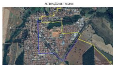
PROPOSTA DE ALTERAÇÃO EM AZUL