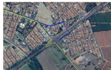
ALTERNATIVA EM AZUL, PASSANDO PELA FAIXA DE PEDESTRE