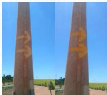
REFORÇO NA SINALIZAÇÃO