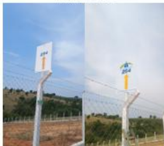
REFORÇO NA SINALIZAÇÃO