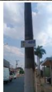
MANEJO DE PLACAS E POSTES