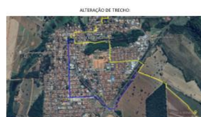
PROPOSTA DE ALTERAÇÃO EM AZUL