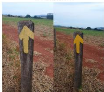
REFORÇO NA SINALIZAÇÃO