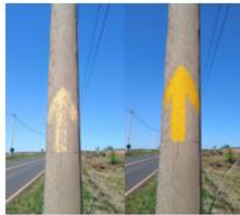
MANEJO DE PLACAS E POSTES