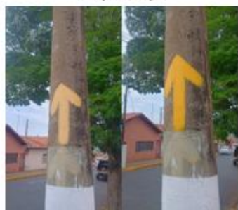
REFORÇO NA SINALIZAÇÃO