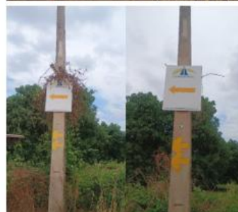
MANEJO DE PLACAS E POSTES