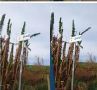
MANEJO DE PLACAS E POSTES