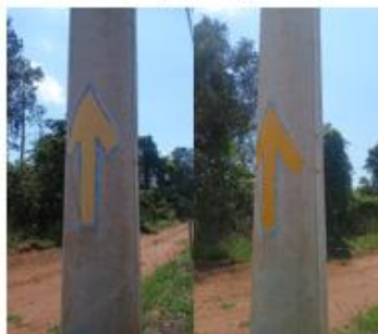
REFORÇO NA SINALIZAÇÃO