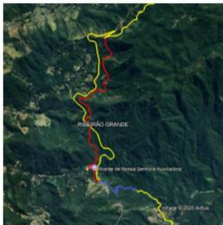
EM VERMELHO O TRECHO DE TRILHO QUE FOI SUBSTITUÍDO PELO AMARELO