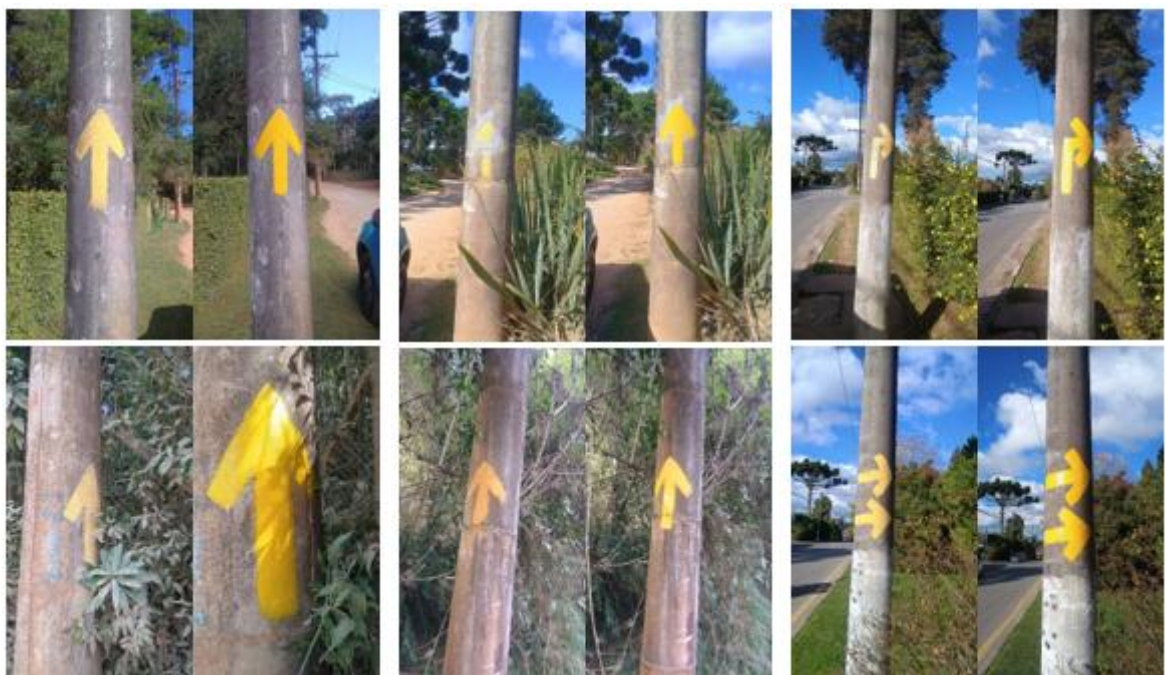
INSTALAÇÃO DE NOVA SINALIZAÇÃO