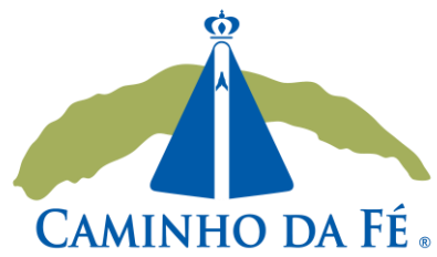
REFORÇO NA SINALIZAÇÃO