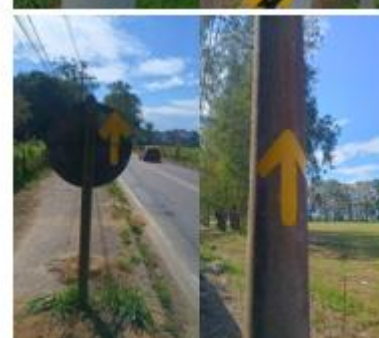
MANEJO DE PLACAS E POSTES