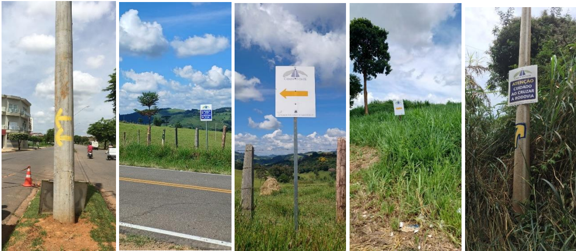
Tambaú- Casa Branca: