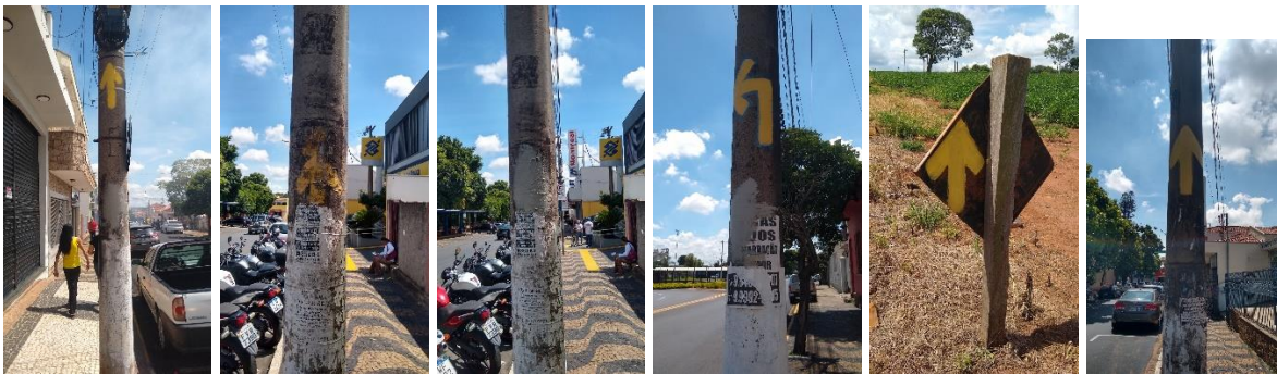
Vargem Grande do Sul – São Roque da Fartura: