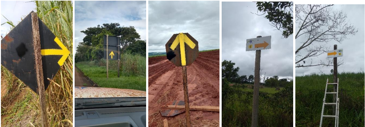
Andradas/ Barra- Ouro Fino: