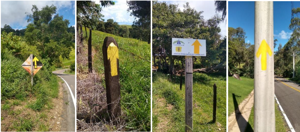
Espirito Santo do Pinhal/ Santo Antonio do Jardim – Andradas: