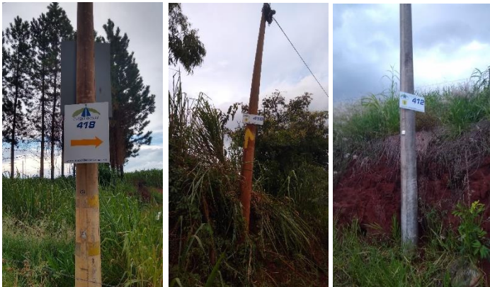
Casa Branca – Vargem Grande do Sul :